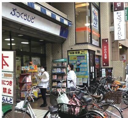
第1ブロック 千住地域調査

子供・若者育成支援強調月間の活動の一つとして足立区青少年委員会は、子供を犯罪や有害環境等から守るため、足立区内の雑誌・ビデオ等の自動販売機の設置状況やビデオレンタル店・ゲームセンター（店舗型）等の実態状況の調査協力活動をしています。