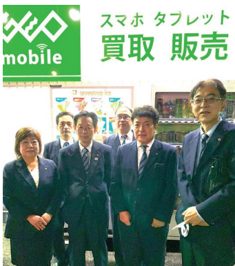
第12ブロック 鹿浜地域調査